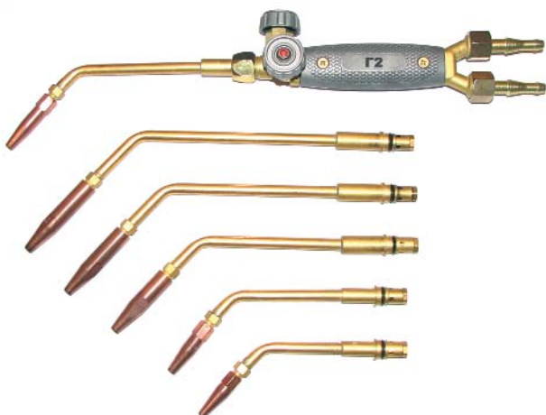
Г2, Г3 / ацетилен