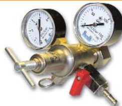
167x160x125 мм; 1,1 кг