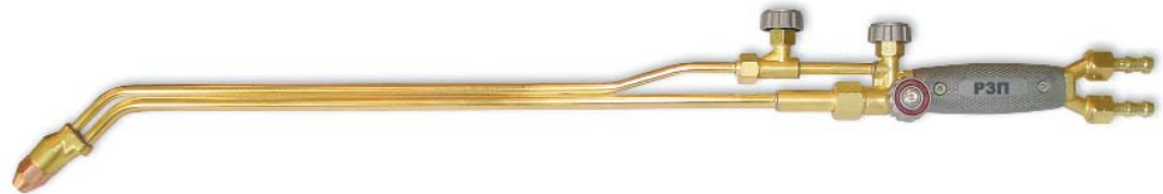
P3П-01-МУ, P3П-02-МУ, P3П-03-МУ / пропан

Повышенное сопротивление обратному удару!