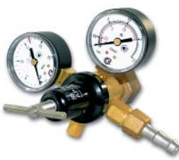
АР-10 (40, 150)-КР1-м / аргон