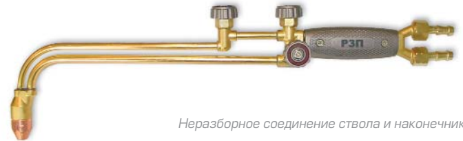
Неразборное соединение ствола и наконечника