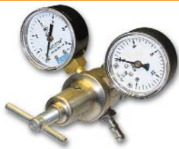
155x125x130 мм; 0,7 кг