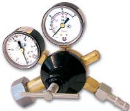
Г-70-КР1 / гелий