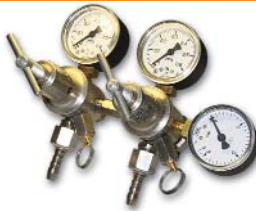
167x176x100 мм; 1,6 кг