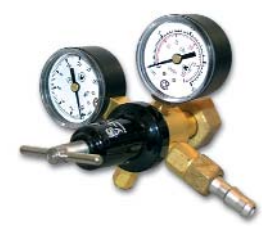
У-30-КР2-м / углекислый газ