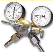
167x135x150 мм; 1,0 кг