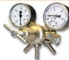
167x135x135 мм; 1,0 кг

Максимальная пропускная способность 0,5 м³/ч