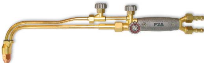
P2A-01-M, P2A-02-M, P2A-03M / ацетилен