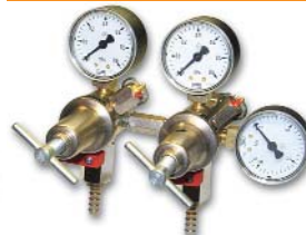
167x176x162 мм; 1,7 кг