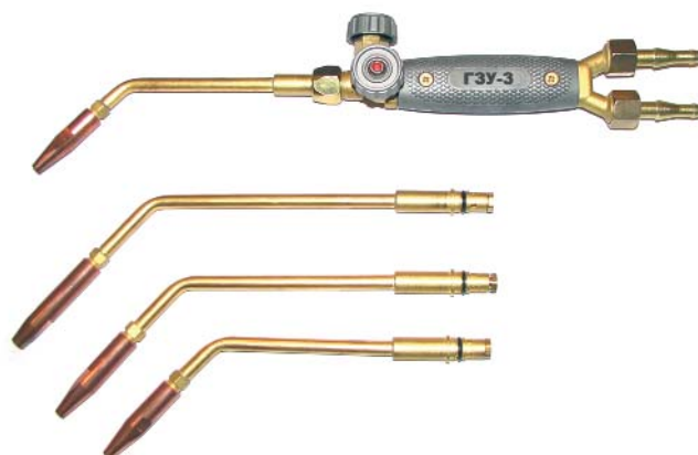
ГЗУ-3, ГЗУ-4 / пропан