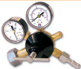
А-30 (90)-КР1 / азот