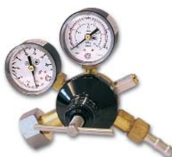
У-30-КР2 / углекислый газ