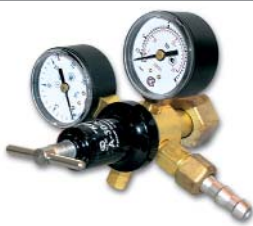
А-30 (90)-КР1-м / азот