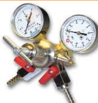
167x160x160 мм; 1,1 кг