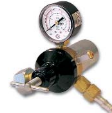
У-30-КР1П / углекислый газ