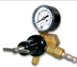
У-30-КР1-м / углекислый газ