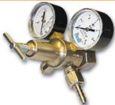
155x125x150 мм; 0,7 кг