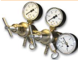
167x176x132 мм; 1,6 кг