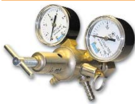
167x135x135 мм; 1,0 кг