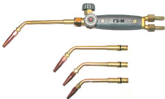
Г2-М / ацетилен