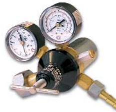
У-30-КР2П / углекислый газ