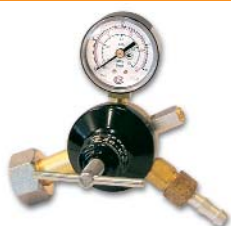
У-30-КР1 / углекислый газ