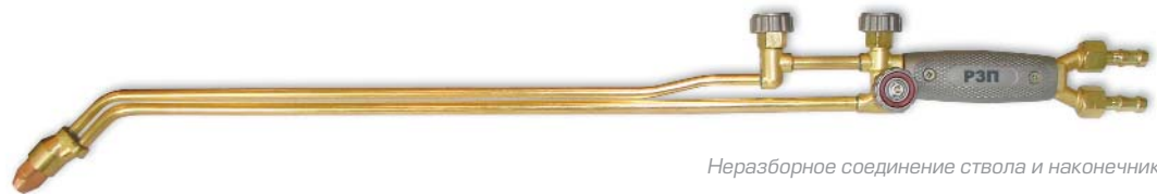
Неразборное соединение ствола и наконечника

Особенности конструкции: вентильная подача газа, конус штока из нержавеющей стали, алюминиевая рукоятка, щелевое сопло.