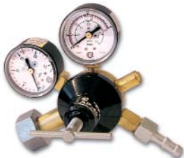
АР-10 (40, 150)-КР1 / аргон