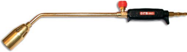
ГВ-100 / пропан