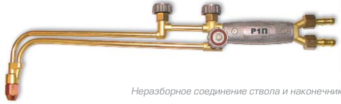
Неразборное соединение ствола и наконечника